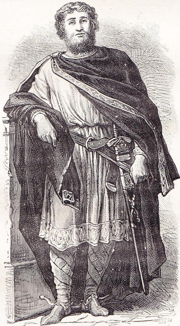
Athelstane de Coninsburgh.

« Que signifie cette comédie ? » leur dit Cedric. « Croyez-vous que nous ignorons de qui nous sommes prisonniers dans ce château ? » Et voulant profiter de cette circonstance pour entamer des négociations,